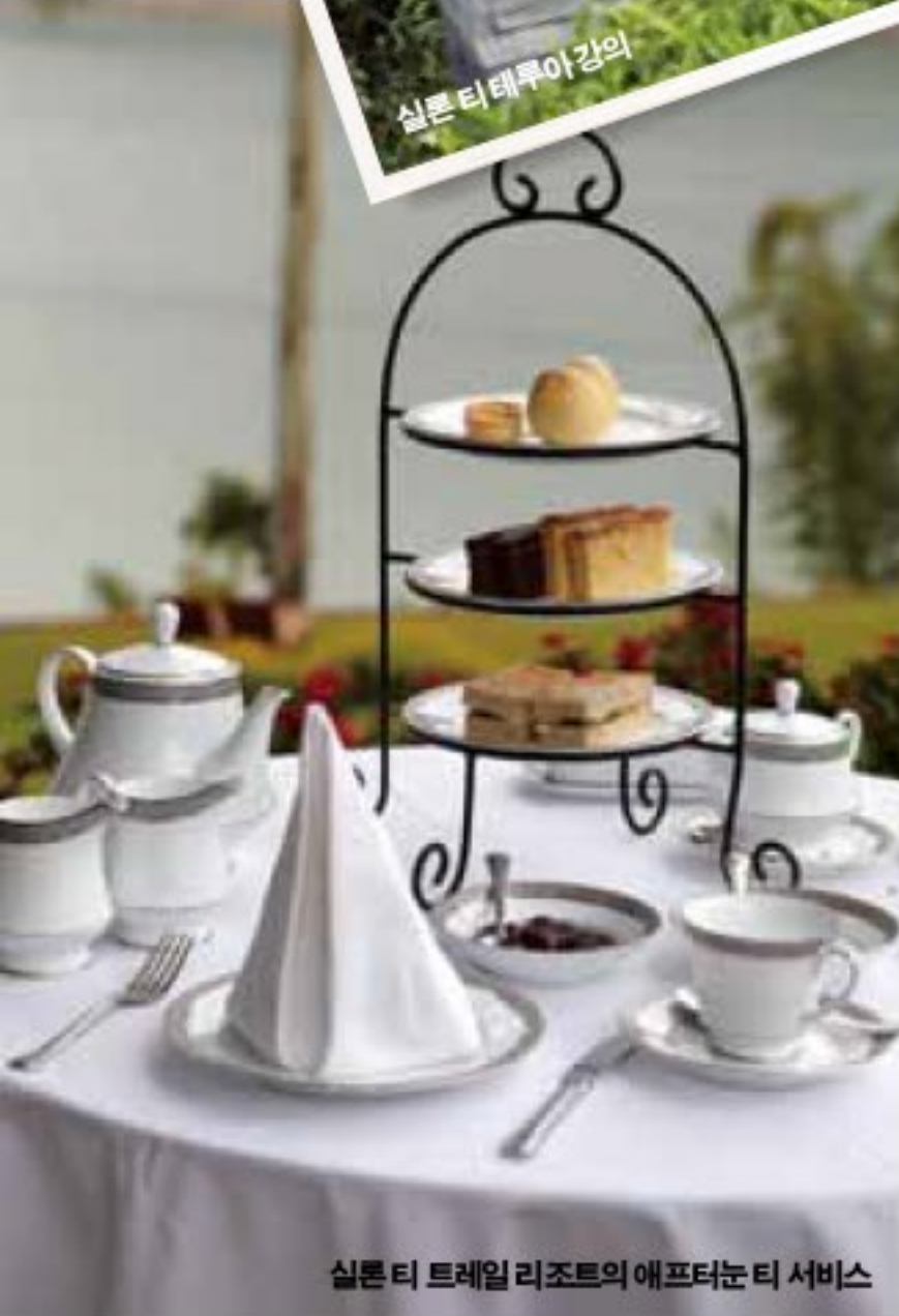
실론 티 트레일 리조트의 애프터눈 티 서비스

6th Day 멜하임 리조트에서 점심 식사 체크아웃 후 호르턴 플레인 Horton Plain 국립공원으로 이동. 약 1시간 30분 소요. 표고 1000m가 넘는 산이 이어진 곳으로 다양한 식물이 군락을 이루고 있다. 마치 정글을 연상시키는 모습. 점심은 30분 거리인 멜하임 Melheim 리조트(www.melheimresort.com)에서. 저녁 비행 시간에 맞춰 콜롬보 국제공항으로 이동. 다음 날 오전 6시 10분경 인천 국제공항에 도착.