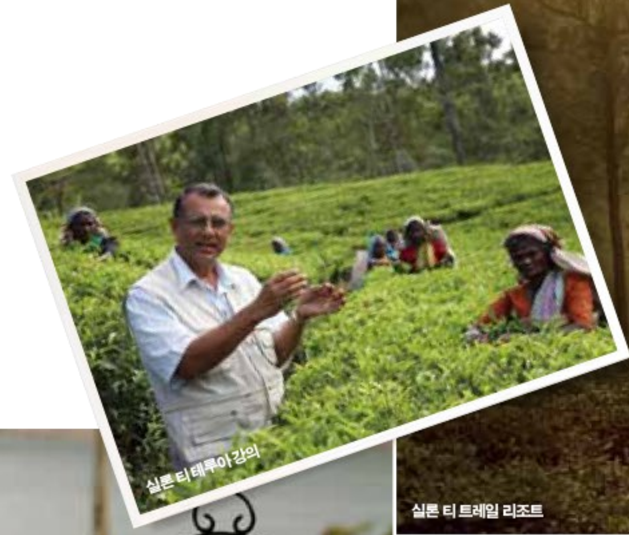
실론 티 테루아 강의