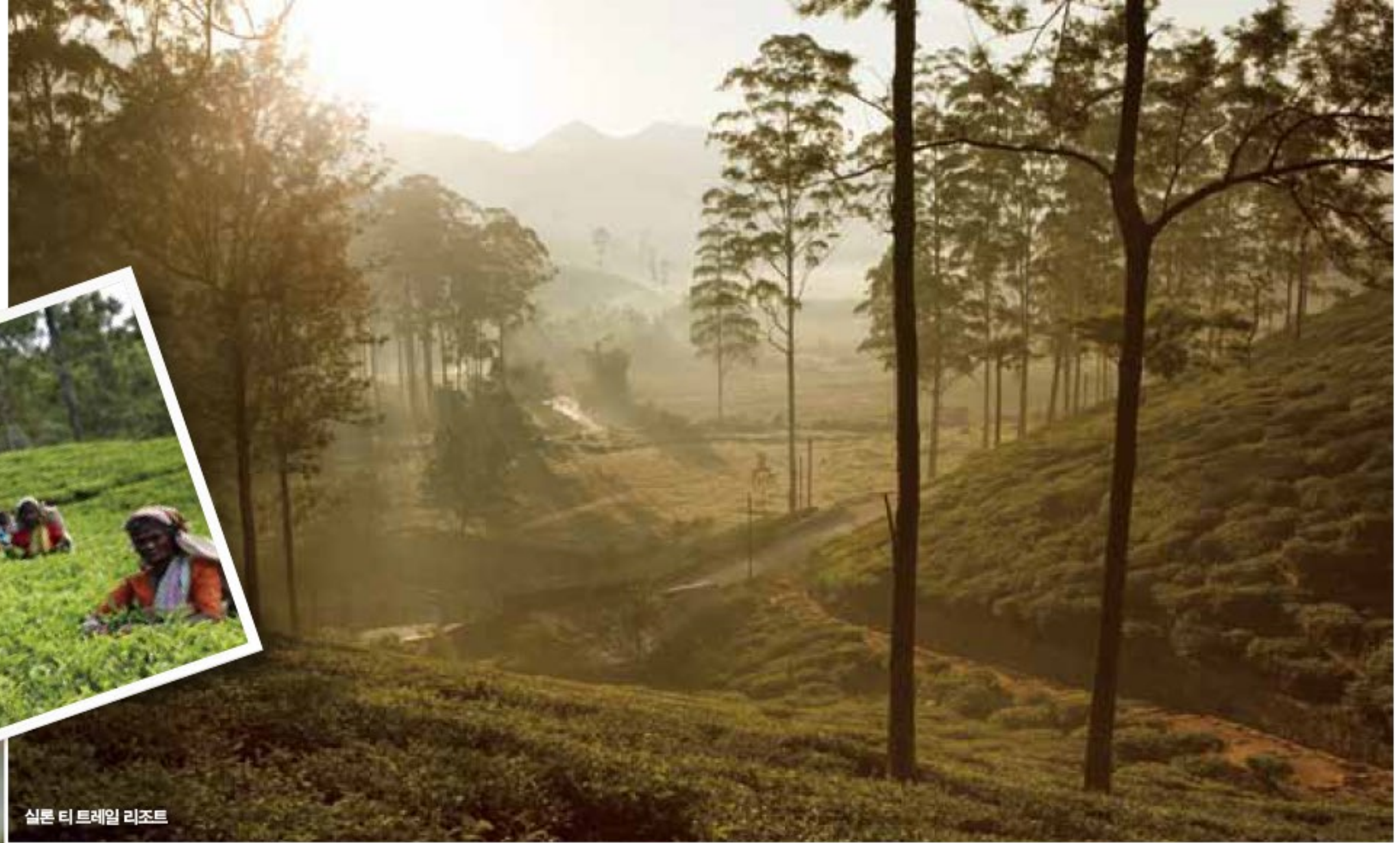
실론 티 트레일 리조트