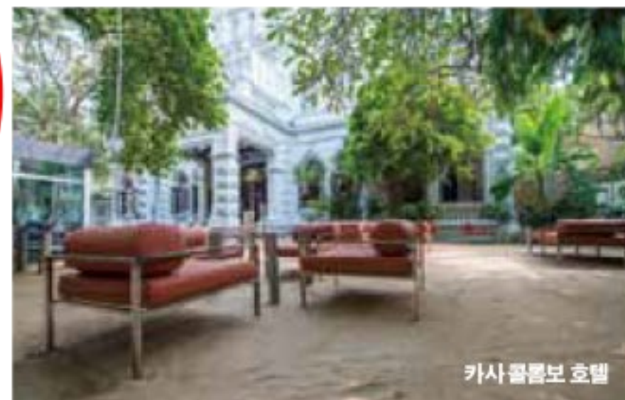
카사 콜롬보 호텔

4th Day 실론 티 트레일 리조트에서 휴식 아만웰라 리조트 체크아웃 후 약 1시간 30분 거리에 있는 우다왈라웨 Udawalawe 국립공원으로 이동. 3만 헥타르 규모의 국립공원은 스리랑카 최대의 코끼리 서식지다. 국립공원 내 사파리 리조트에서 점심을 즐긴 후 약 3시간 30분 거리의 실론 티 트레일 Ceylon Tea Trail 리조트로 이동. 세계적으로 유명한 홍차 경작지 리조트로 전원 속 별장 같은 모습이다. 저녁 식사는 호텔